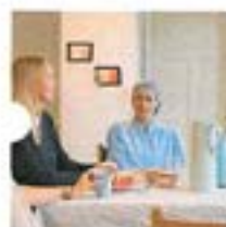
26. August 2025 | Møter i Barnehagen, Om Foreldresamarbeid

Slik legger du til rette for møteplasser i barnehagen