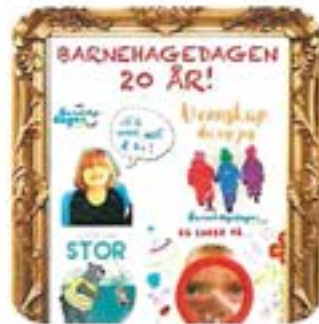
Tema for Barnehagedagen 2025 var «La leken leve!».

Barnehagedagen har blitt en tradisjon og markerte i 2025 sitt 20-årsjubileum. Arrangementet var også i år et samarbeid mellom Fagforbundet, Utdanningsforbundet og FUB. Utvalgsleder deltok og holdt innlegg, mens sekretariatet planla, ledet og evaluerte arrangementet. Arrangementet hadde god deltakelse og gode innlegg, og ga betydelig merverdi for samarbeidet mellom barnehage og hjem. Mange fulgte arrangementet i sanntid, og noen gjennomførte personalmøter hvor opptaket ble vist i etterkant. Arrangementet ble vurdert å gi god effekt sett opp mot kostnadene.