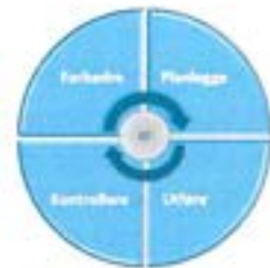
Kontinuerlig forbedring (Lean-verktøy)