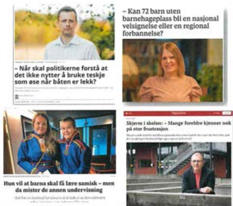
Noen eksempler på medieoppslag i 2025.